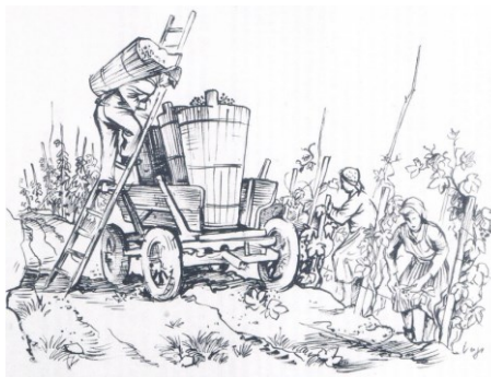
Zeichnung von Herbert Vogt