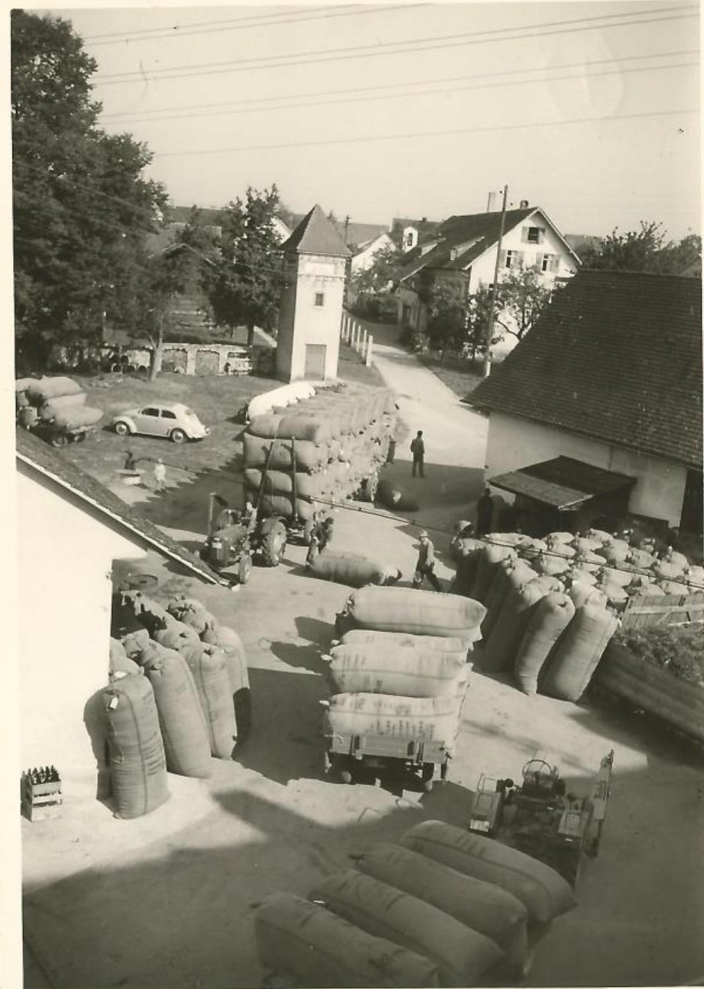
Hopfenanlieferung mit Hopfenwaage hinter dem Rathaus, um 1958