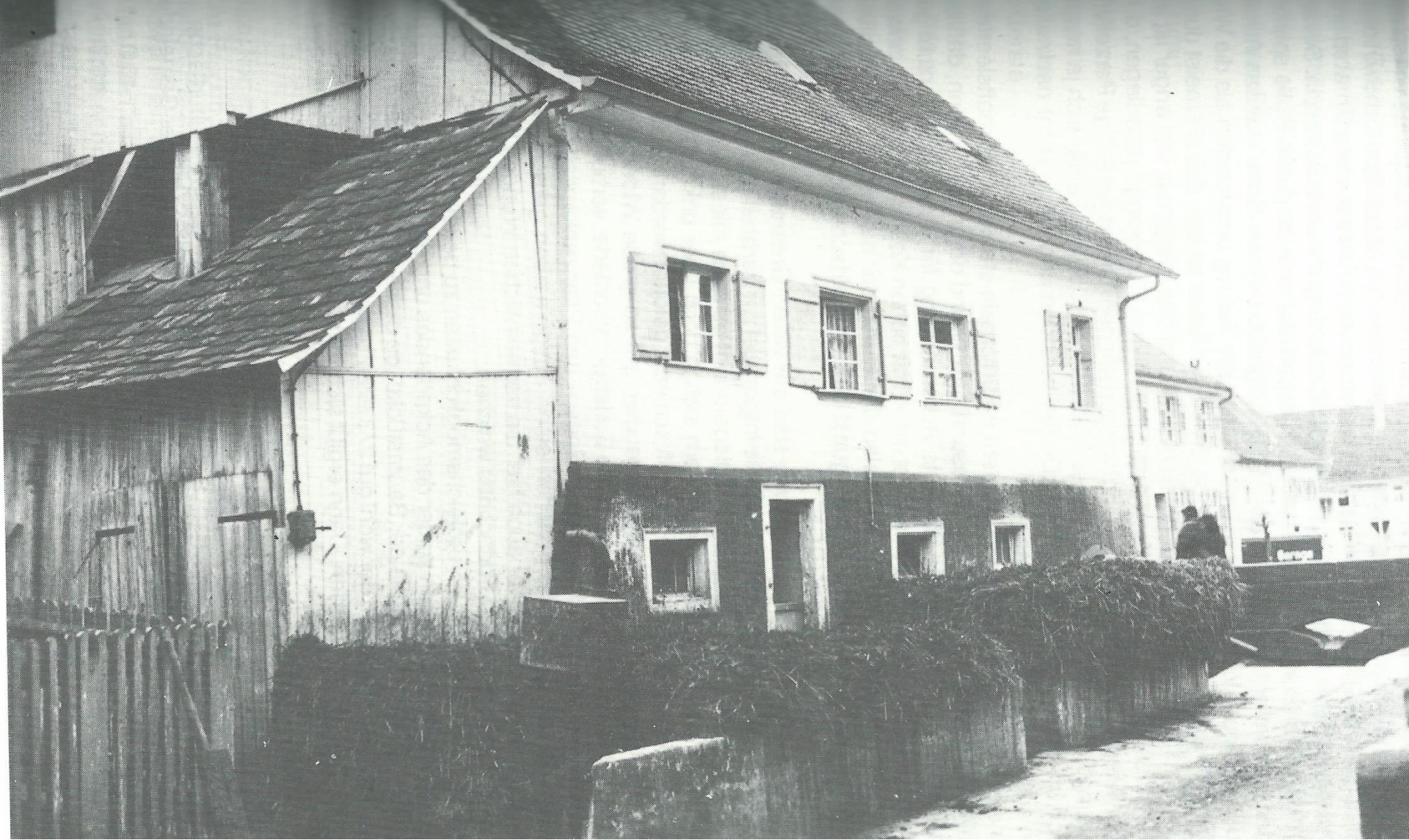
Haus Max Rauber, Hauptstraße 11; Dunglege (Misthaufen) und Eingang zum Kuhstall, um 1935