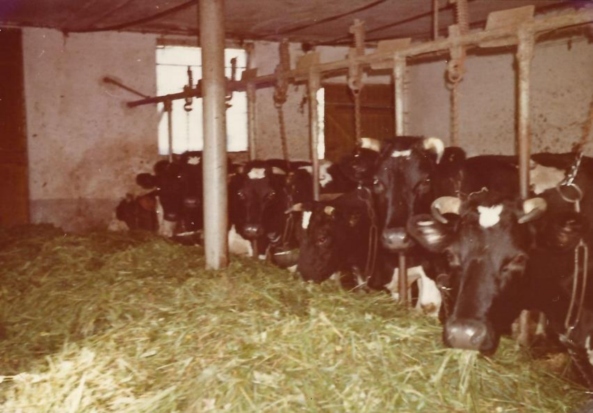
Stall von Artur Sauter im Jahr 1969