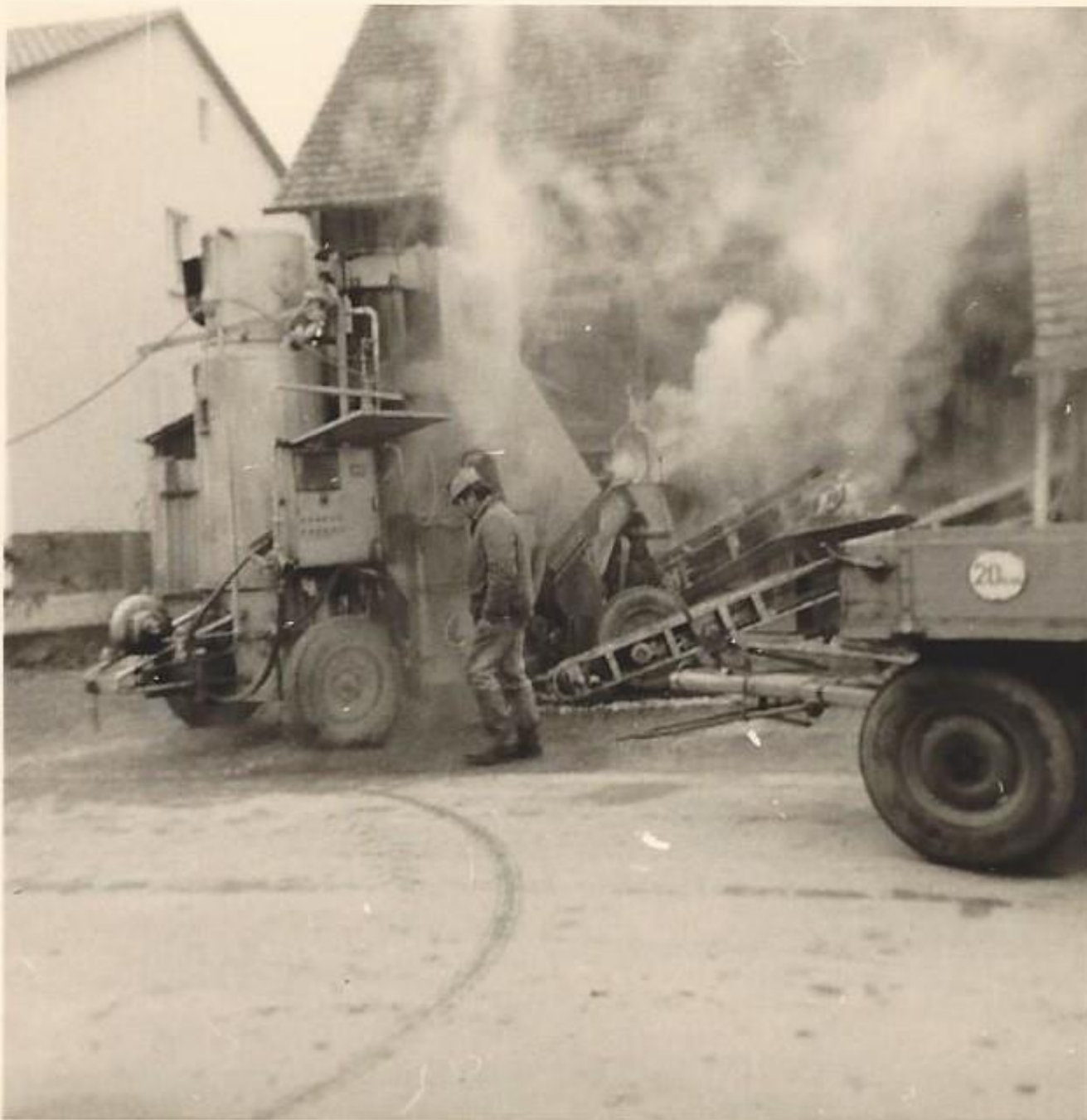
Bodebirredämpfer Waibel, Owingen, um 1967