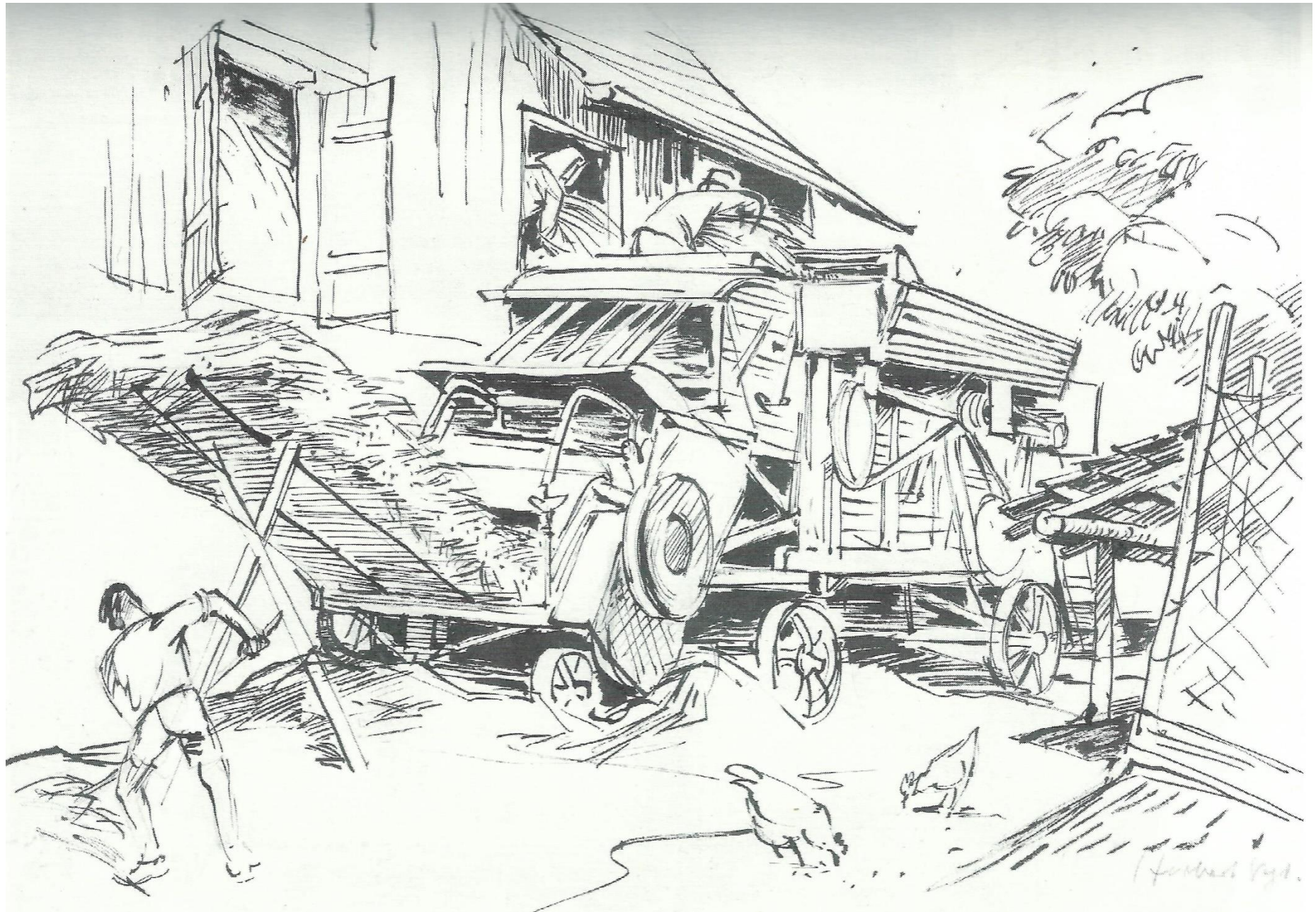
Dreschmaschine um 1950 bei Hermann Steffelin; Tuschezeichnung von Herbert Vogt