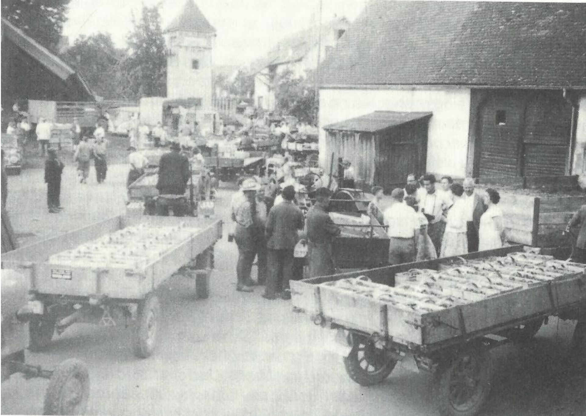
Zwetschgenmarkt hinter dem alten Rathaus, um 1960