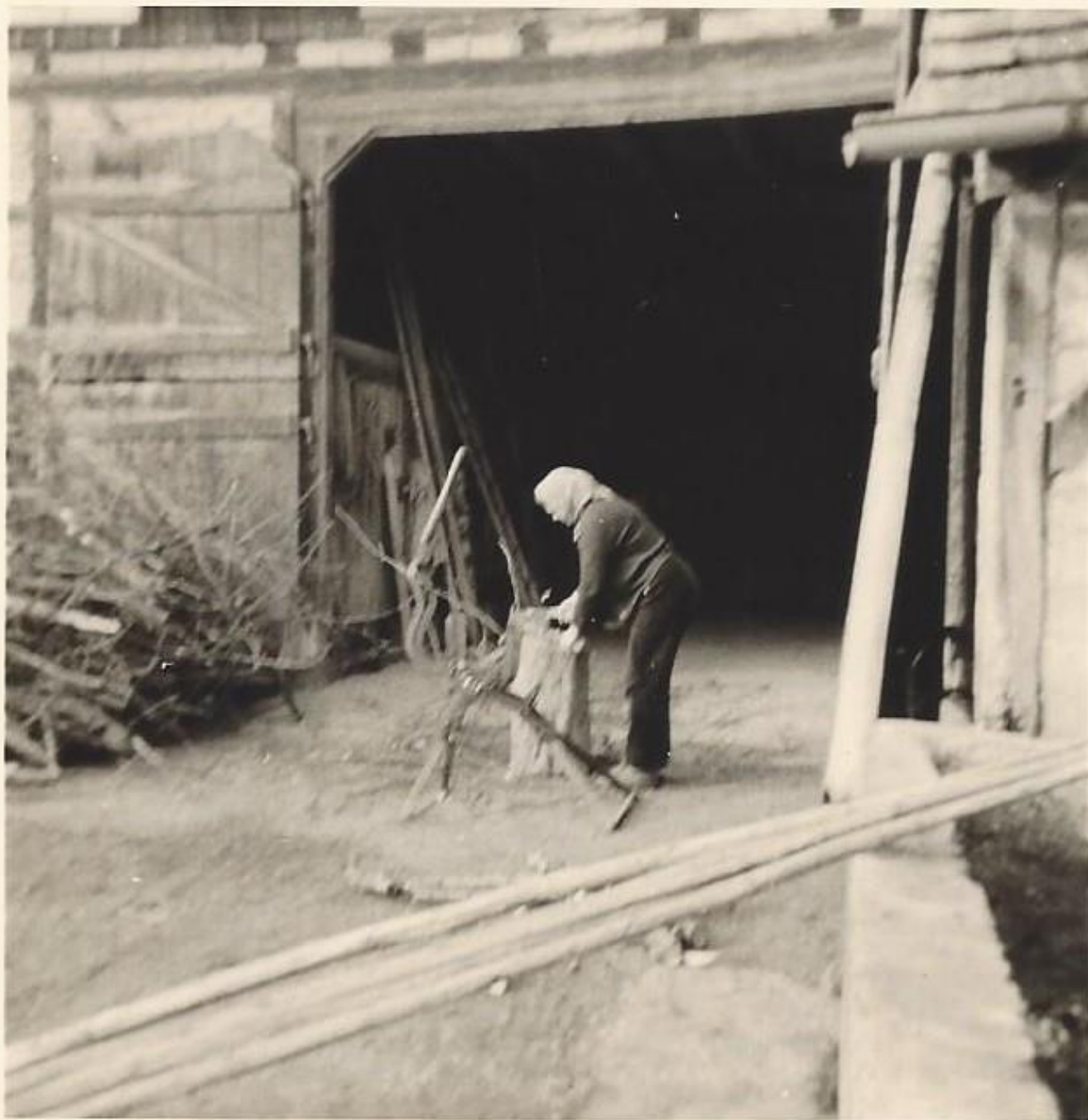
Buschele hacken Resle Birkhofer um 1960