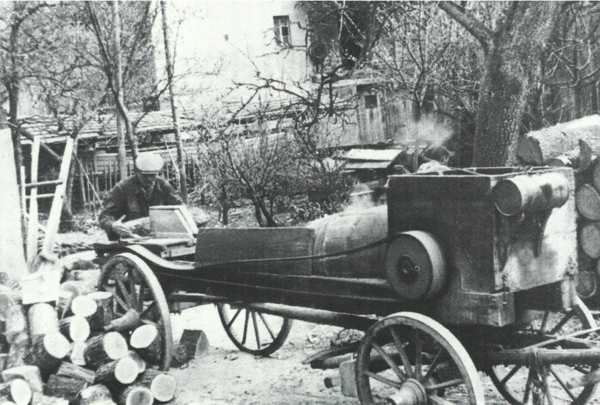
Heinrich Einhart an der fahrbaren Holzsaäge, um 1930