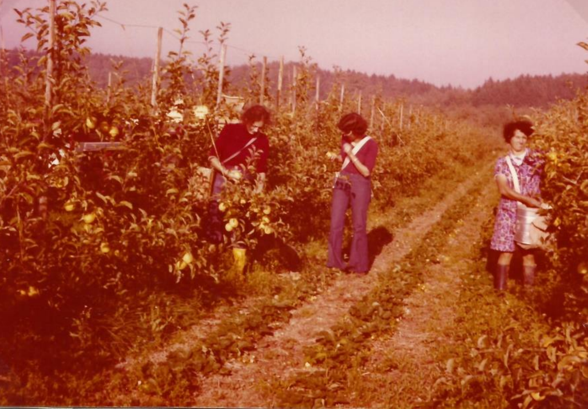
Apfelanlage Bahnacker 1976; Bild von Artur Sauter