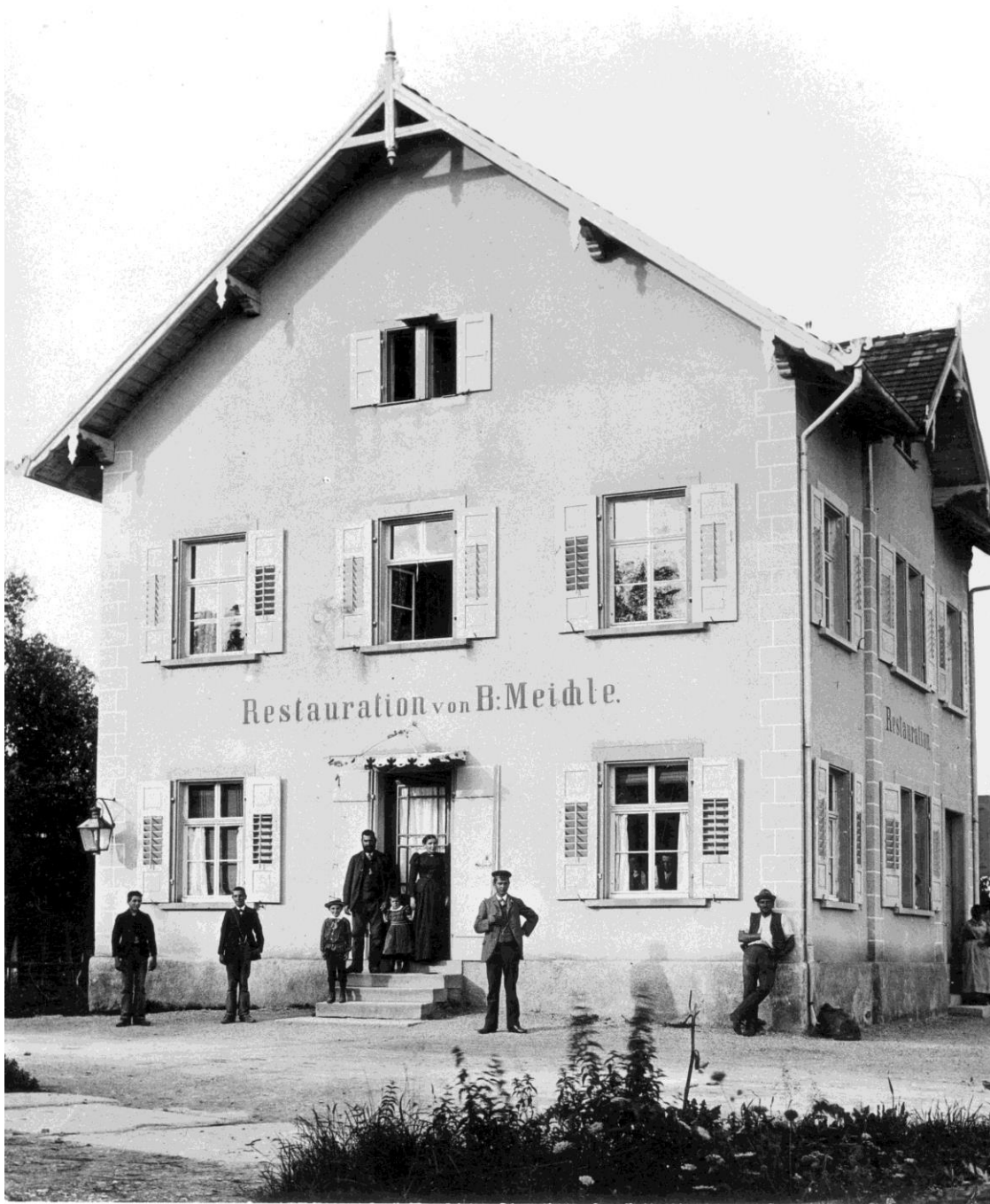
Seehof 1885; Ursprungsgebäude