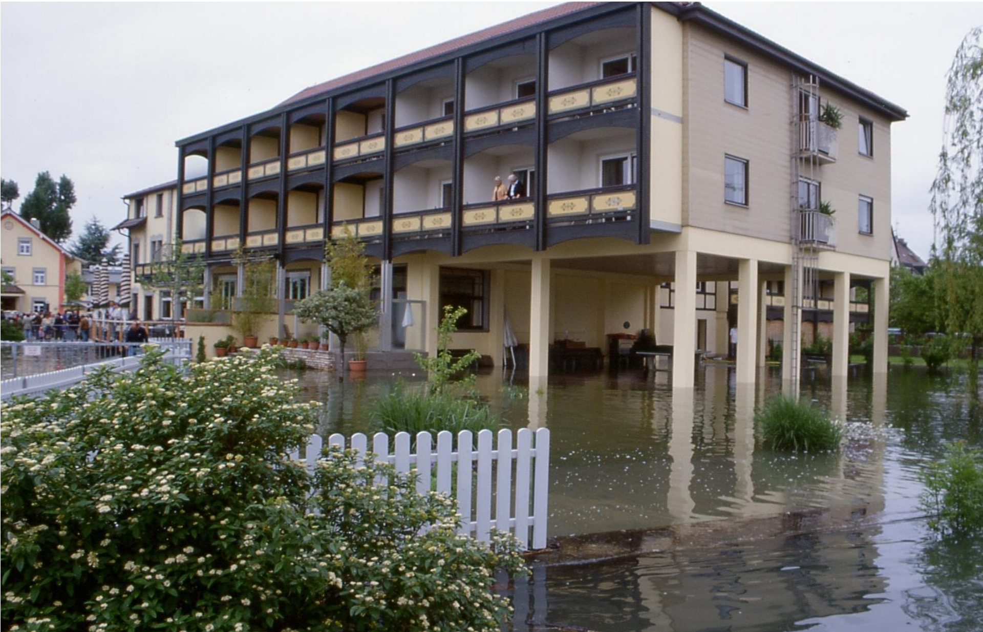
Seehof 1999; Hochwasser