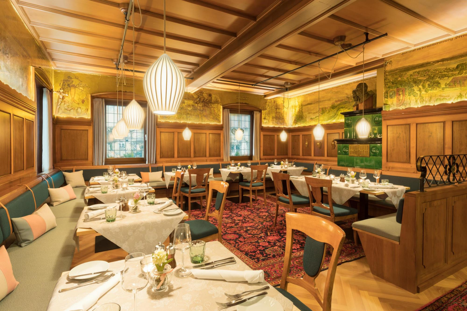
Seehof, Badische Weinstube heute