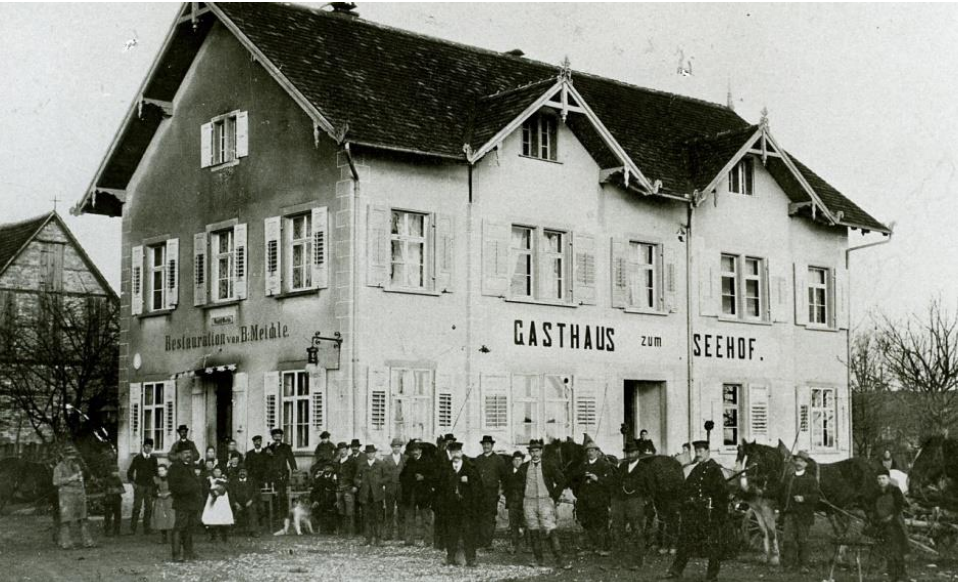
Seehof um 1898 mit angebautem rechten Flügel