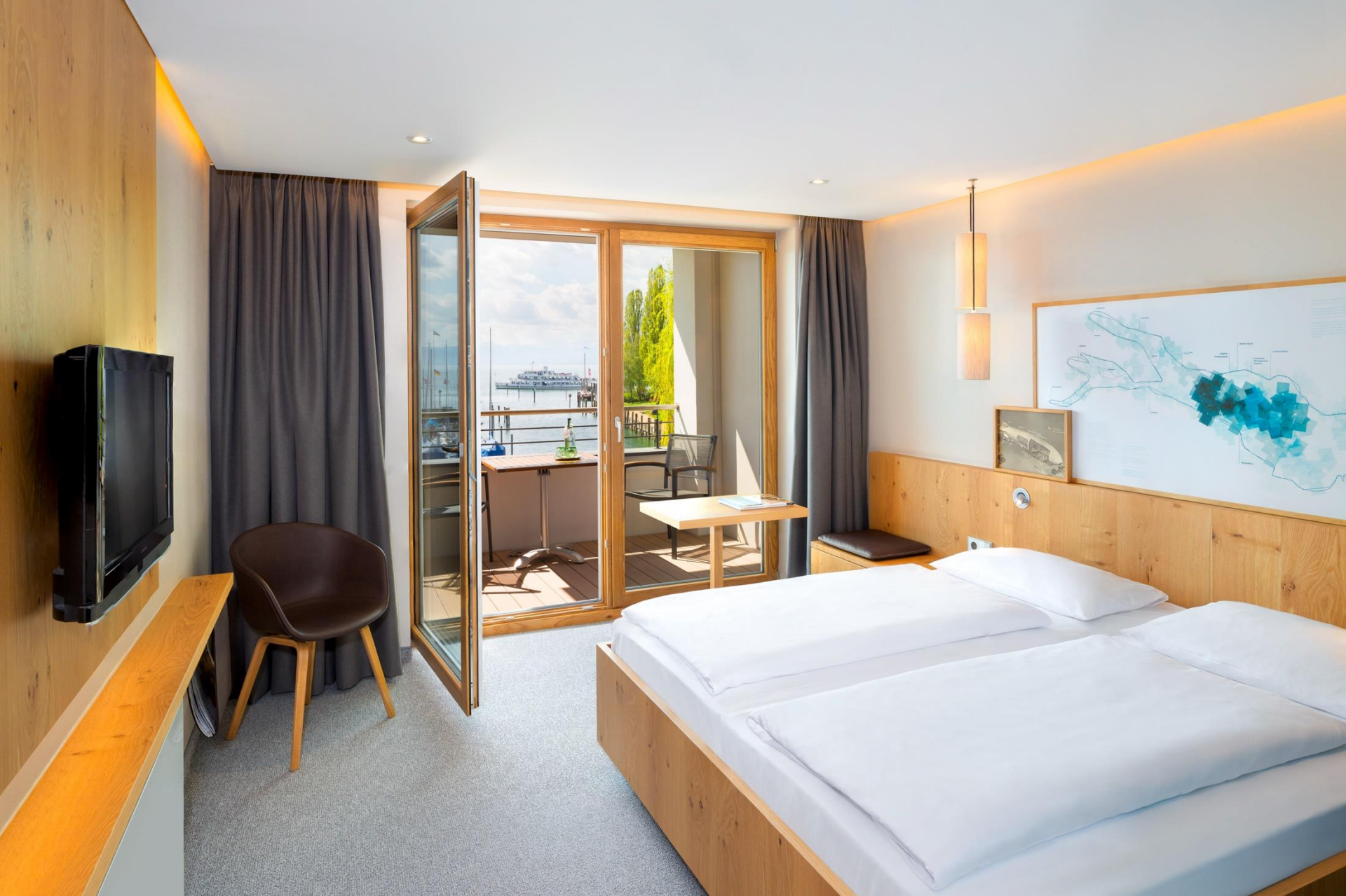
Seehof, Standard Doppelzimmer heute