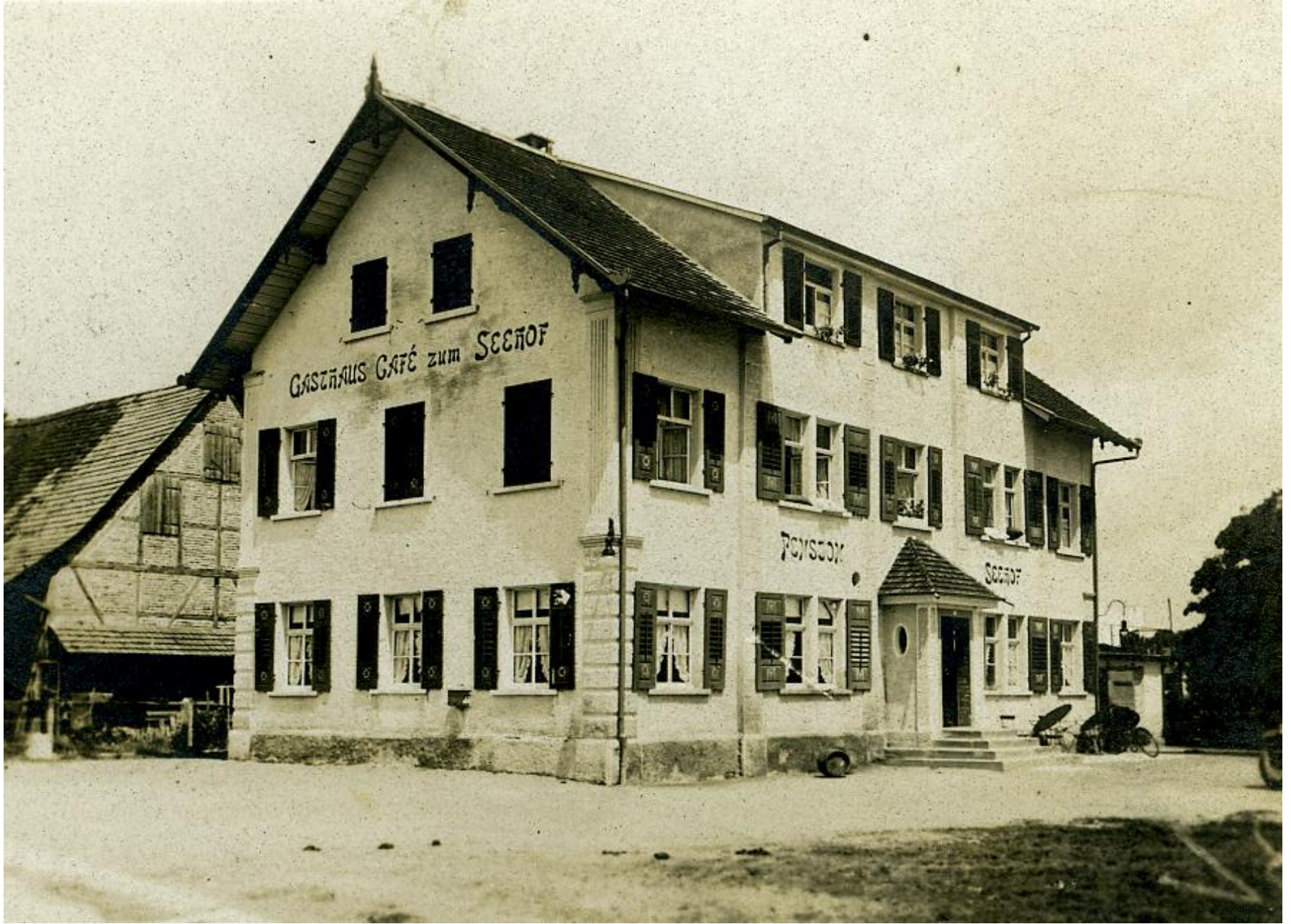
Seehof um 1925 mit Dachausbau