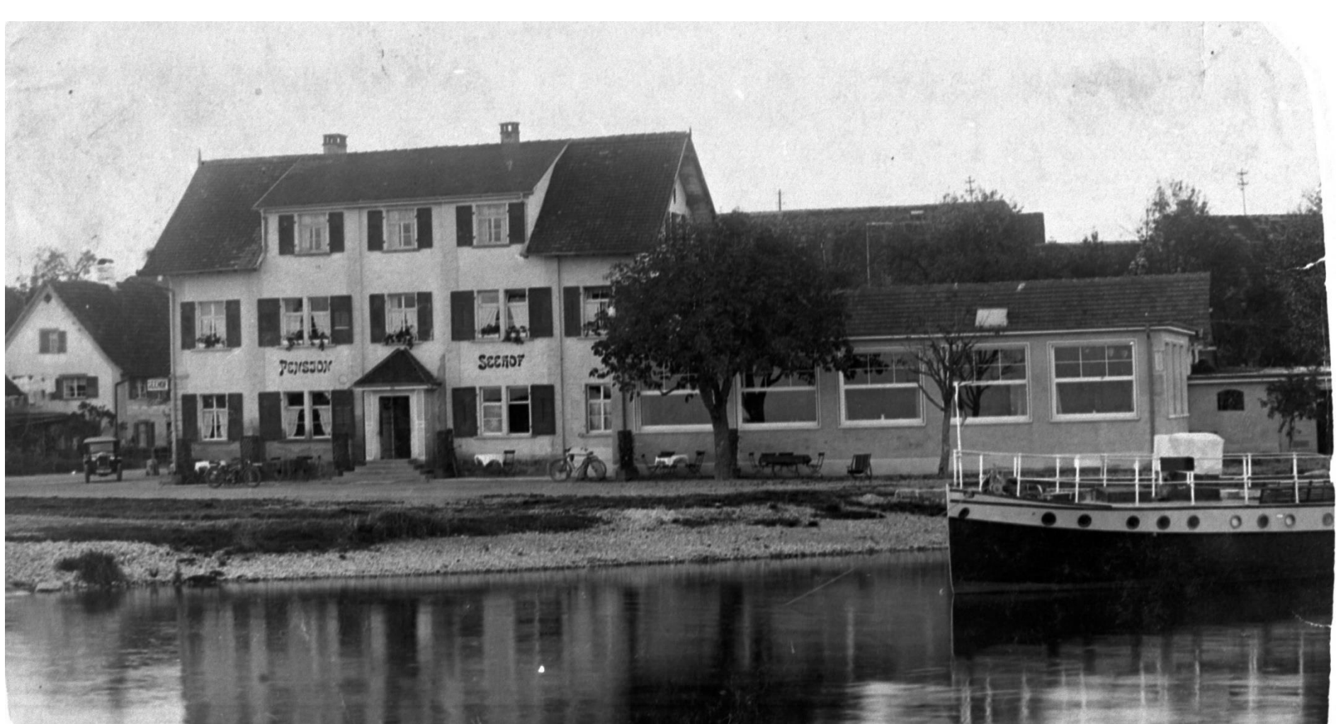
Seehof August 1930; Anbau Saal, Eröffnung am 13. Juli 1930