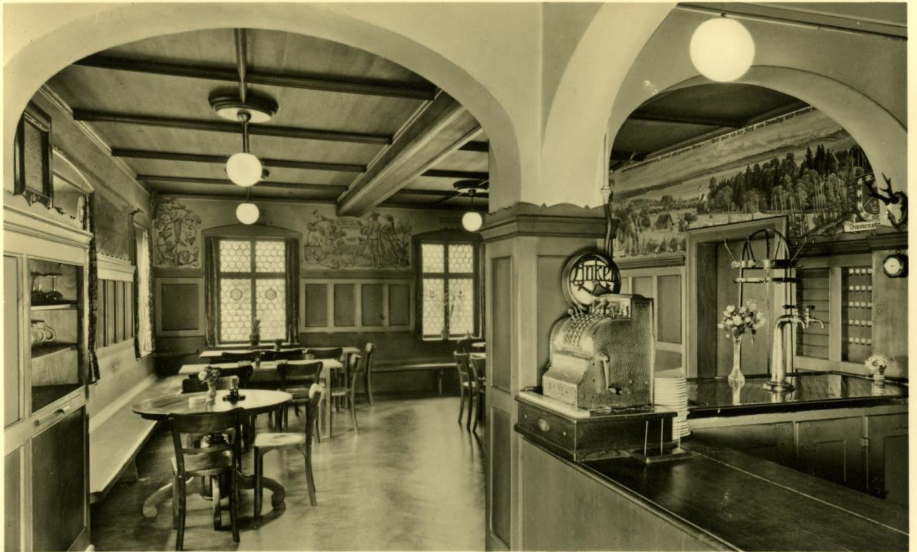
Badische Weinstube „Seehof“