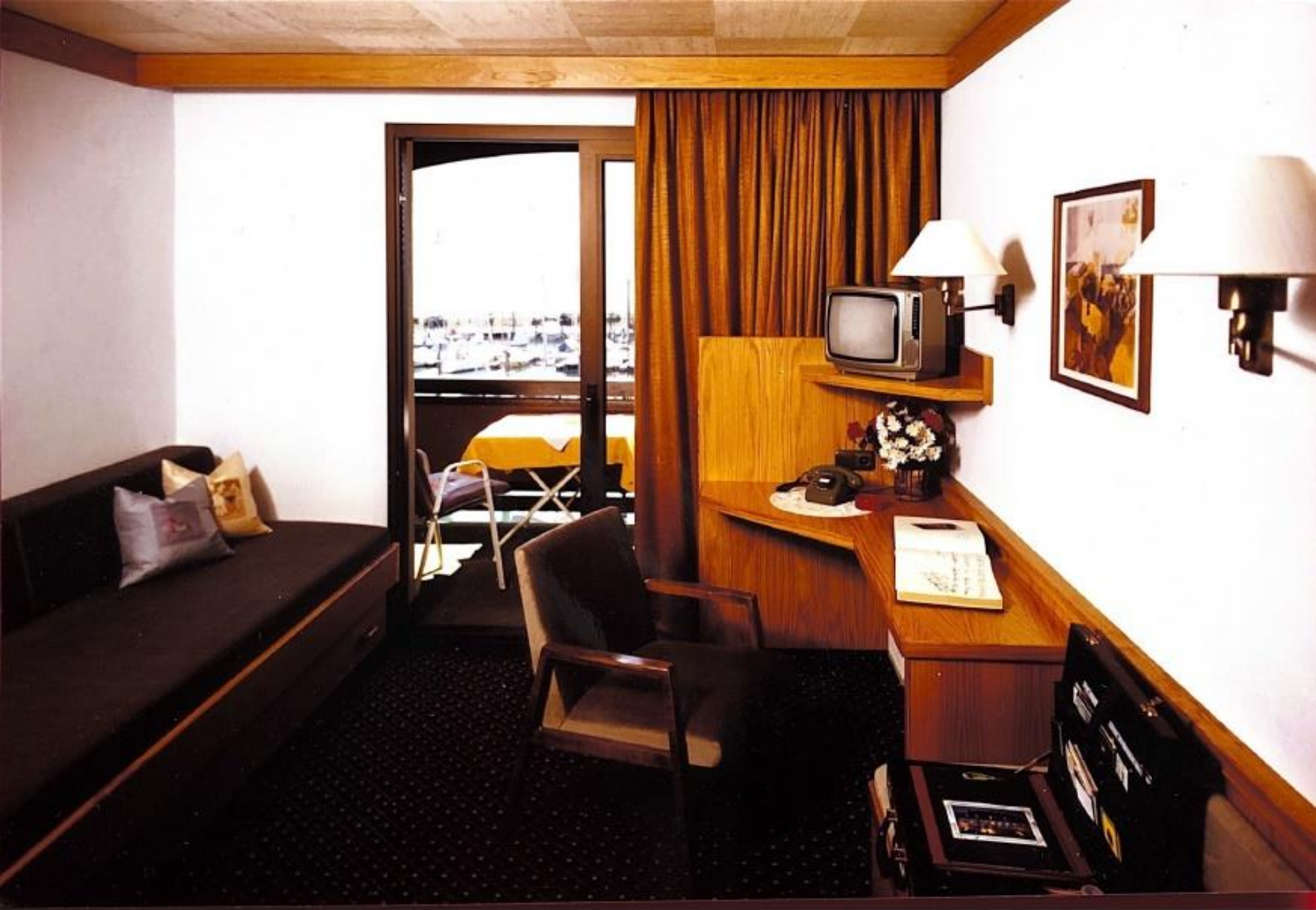
Seehof, Standard Doppelzimmer 80er Jahre