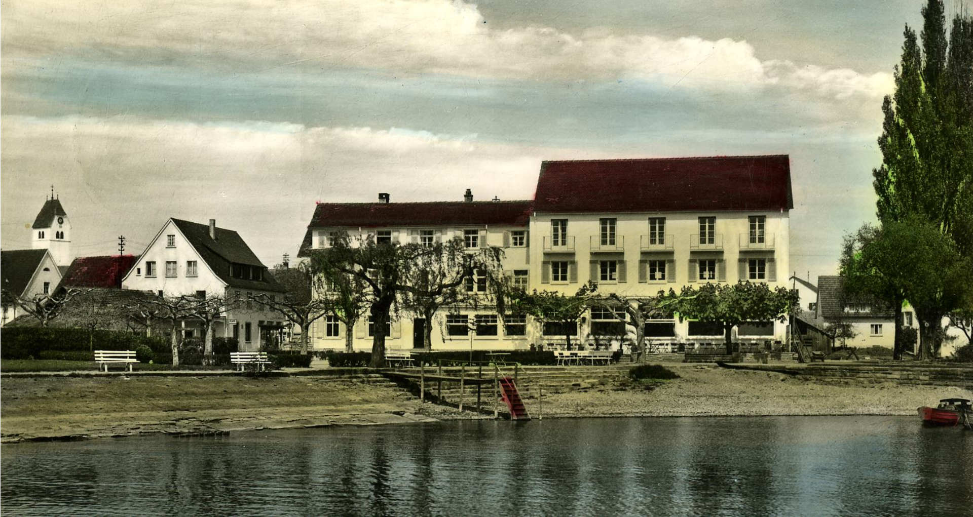
Seehof um 1958; Aufgestockter Anbau