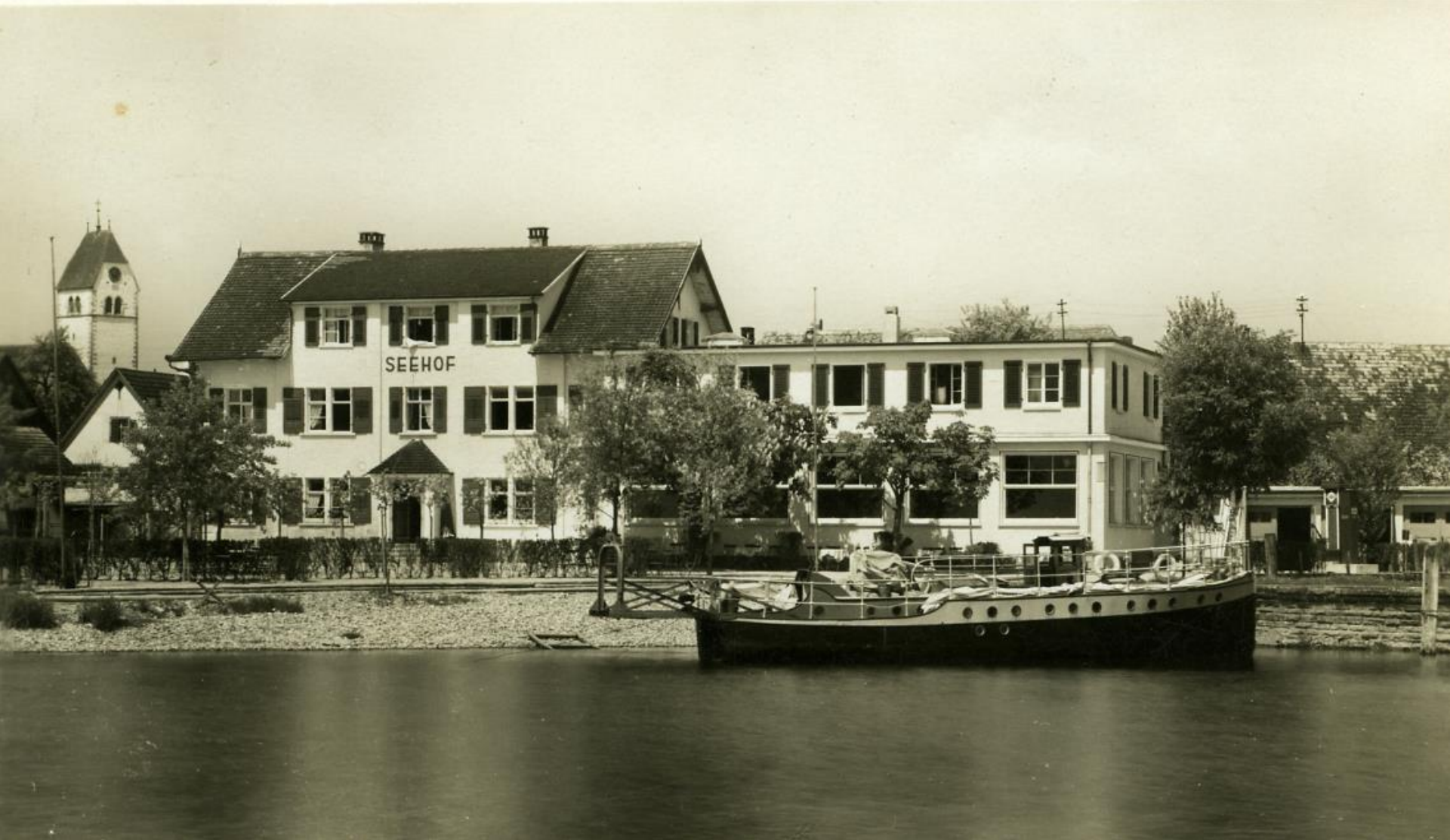
Seehof um 1935; Aufgestocker Saal mit Fremdenzimmern