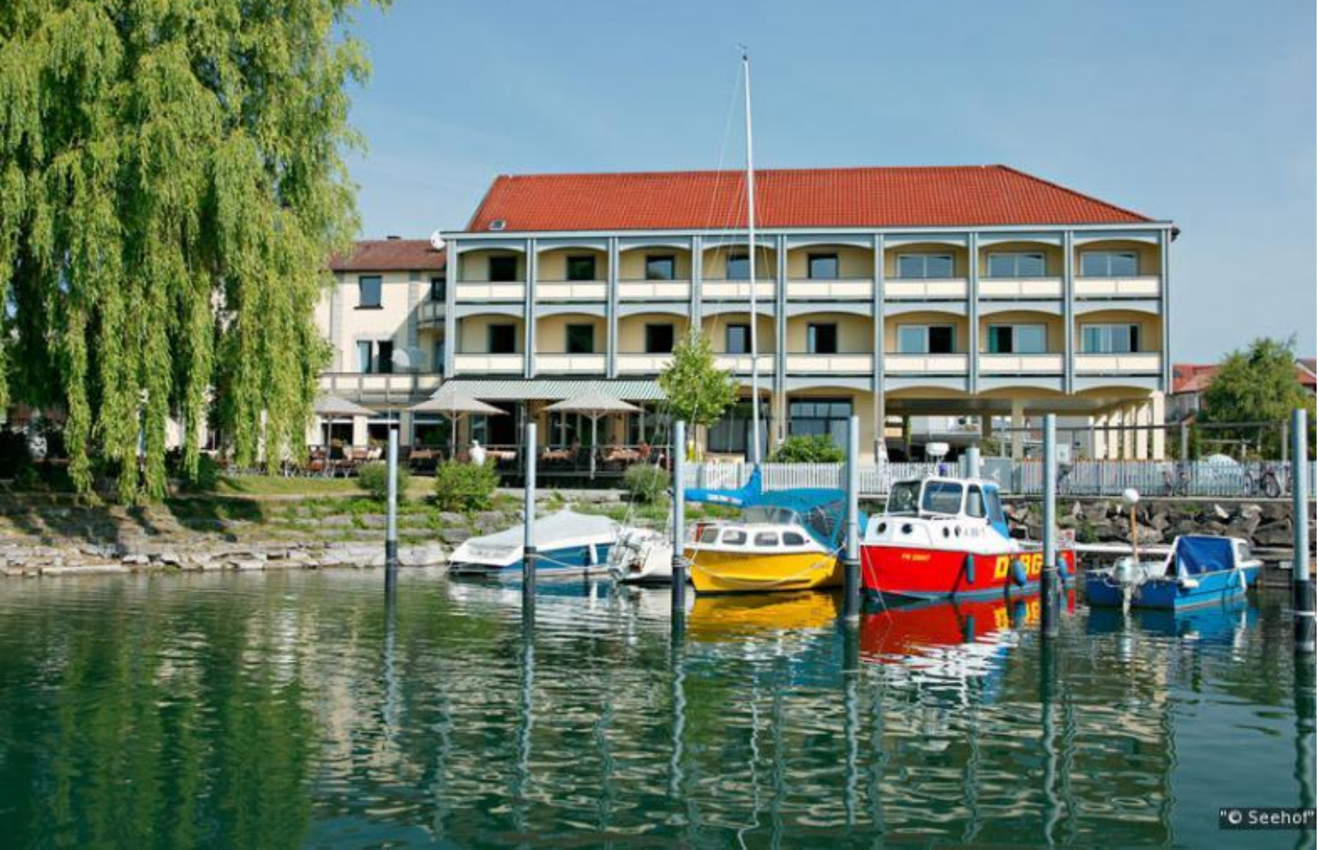
Seehof um 2000; Durchgängiges Dach