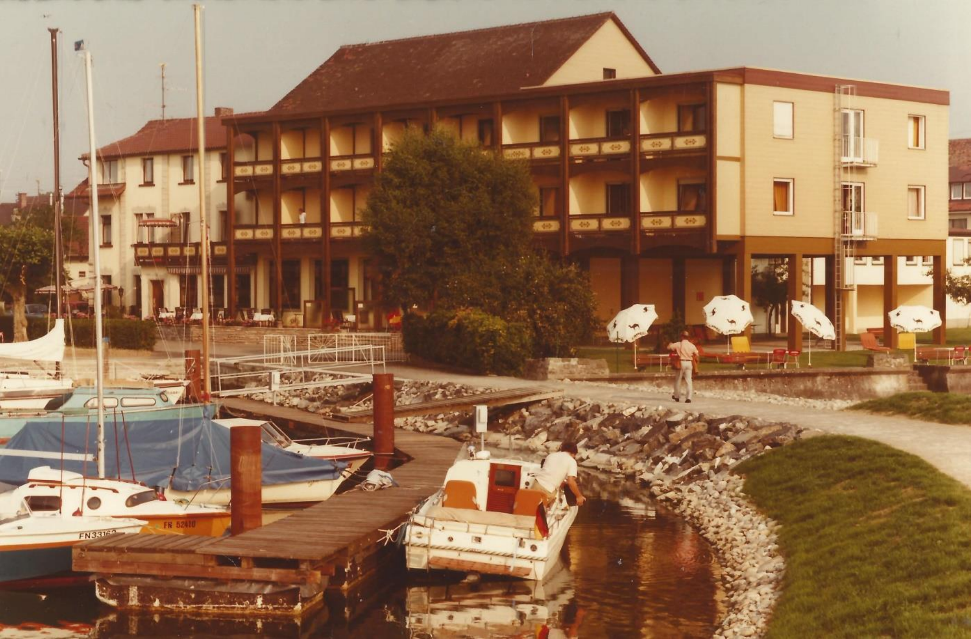
Seehof 1982; Einheitliche Front im Anbau