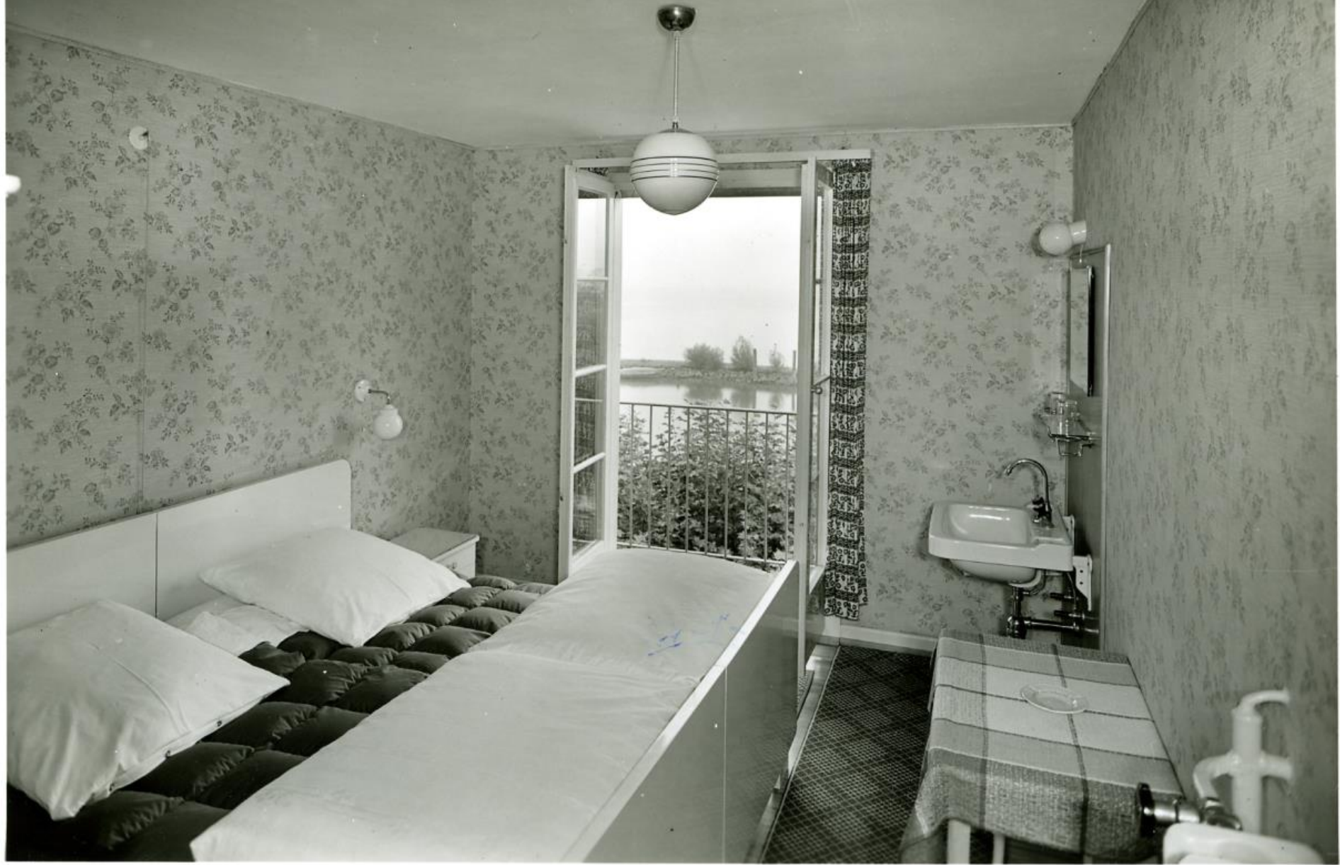
Seehof, Standard Doppelzimmer 50er Jahre