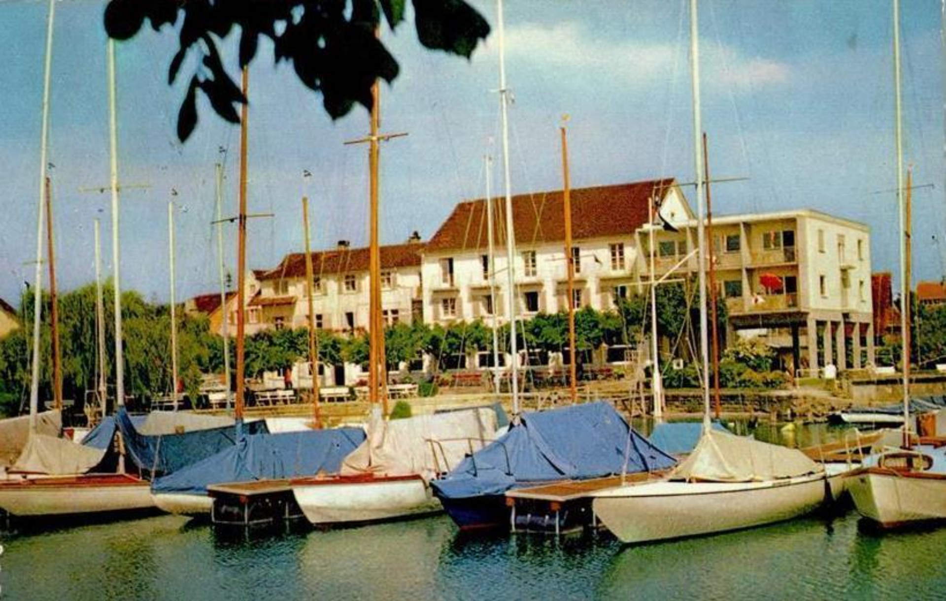
Seehof 1976; Mit Stelzenanbau im Osten, errichtet 1969