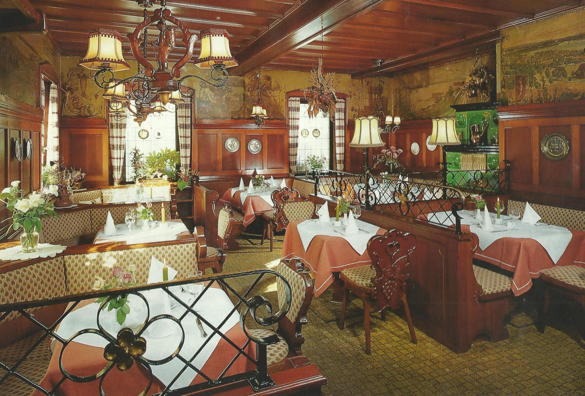
Seehof, Badische Weinstube um 1980